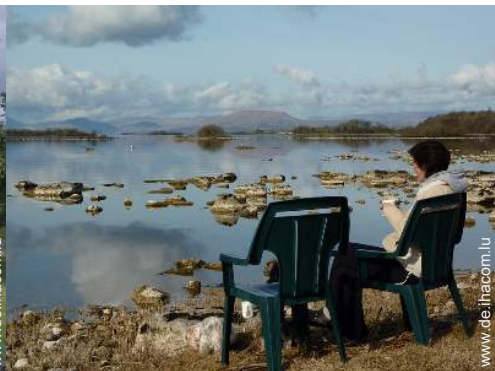
Blick auf See