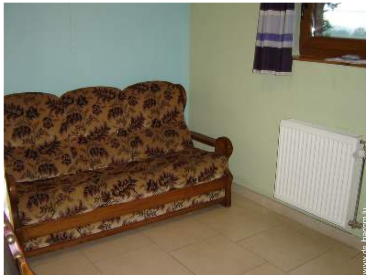
Schrankbett(en) 2 Personen