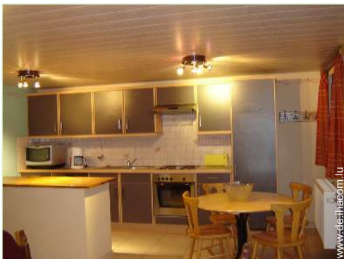
große amerikanische Küche