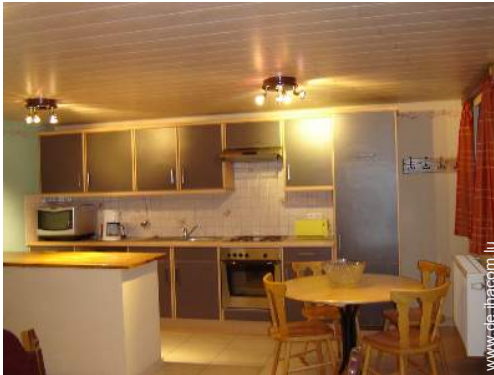
große amerikanische Küche