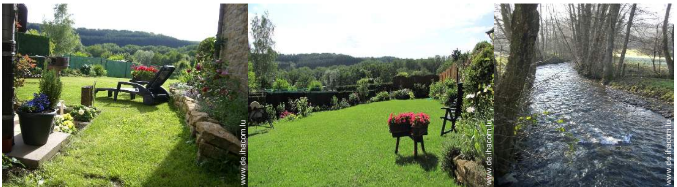
Blick auf Wald