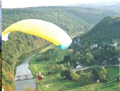
Flugsport in der Nähe