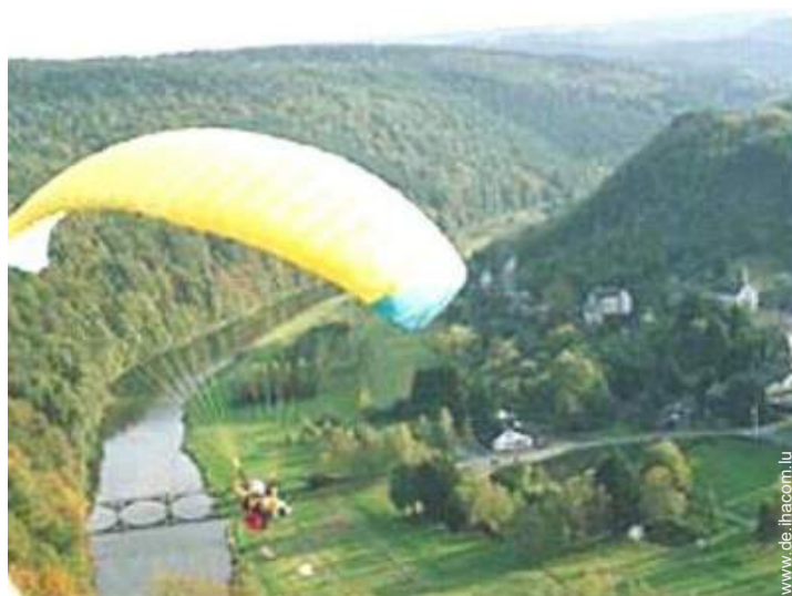
Flugsport in der Nähe