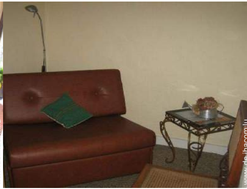
Klappbett(en) 1 Person