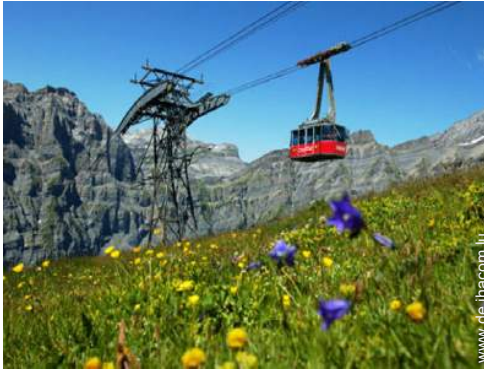
Sommeraktivitäten in der Nähe