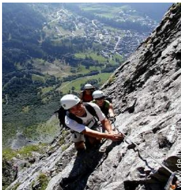
Via ferrata (Klettersteig)