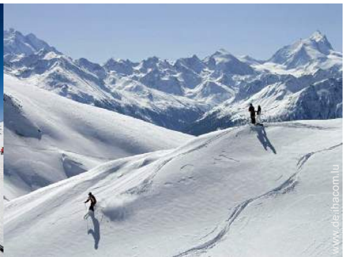
Winteraktivitäten in der Nähe