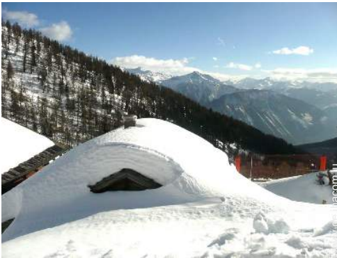
Winteraktivitäten in der Nähe