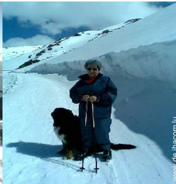
Winteraktivitäten in der Nähe