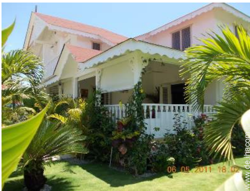
Villa mit Charme