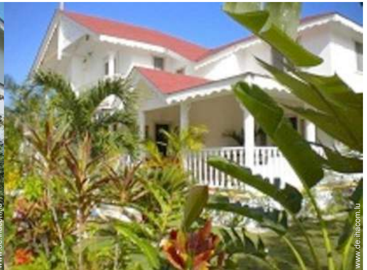
Villa mit Charme