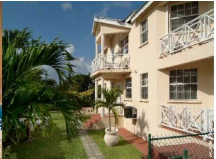
Anwesen mit Charme