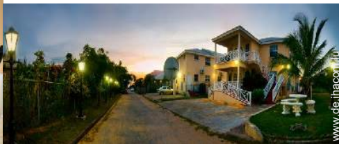
Blick auf Straße/Avenue