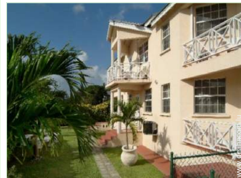
Anwesen mit Charme