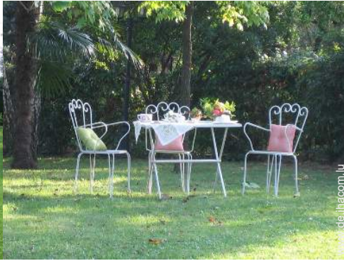
Blick auf Wiese