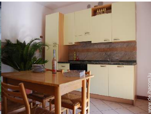
große separate Küche