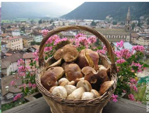
Gebirgsaktivitäten in der Nähe