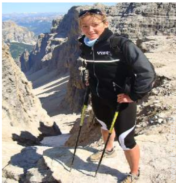
Via ferrata (Klettersteig)