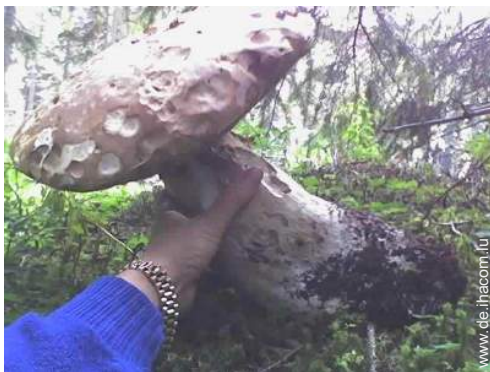
Gebirgsaktivitäten in der Nähe