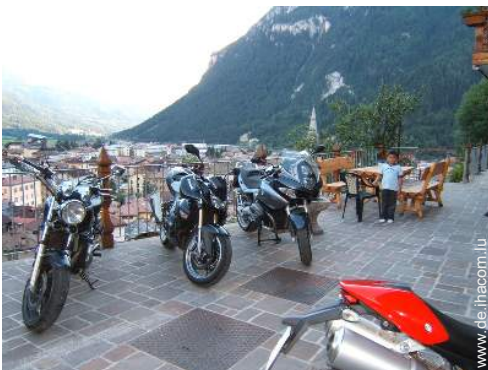
Motorsport in der Nähe