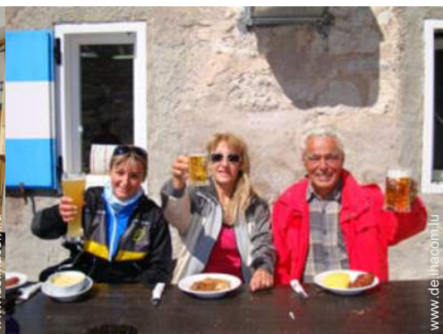
Gebirgsaktivitäten in der Nähe