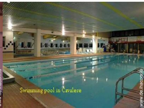
Swimming pool in Cavalese