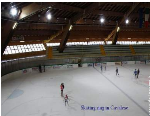
Skating ring in Cavalese