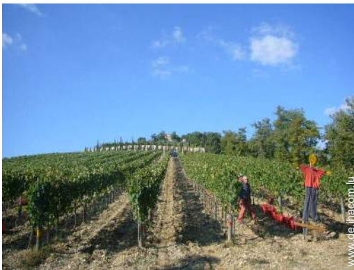
Blick auf Weinberge