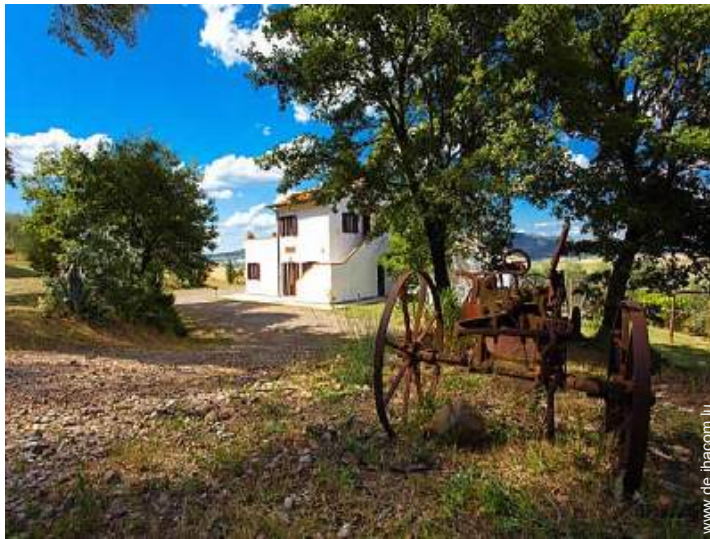
ehem. Bauernhof mit Charme