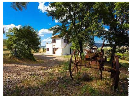
ehem. Bauernhof mit Charme