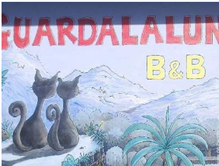
Außenanlage zur Verfügung der Gäste