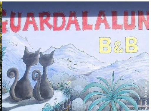
Außenanlage zur Verfügung der Gäste