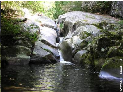
Badevergnügen in der Nähe