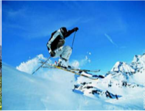
Winteraktivitäten in der Nähe