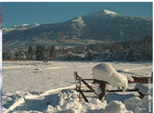
Winteraktivitäten in der Nähe