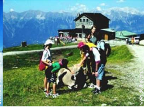
Sommeraktivitäten in der Nähe