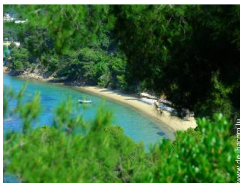
Badevergnügen in der Nähe