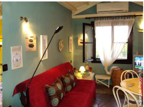
Sofabett(en) 1 Person