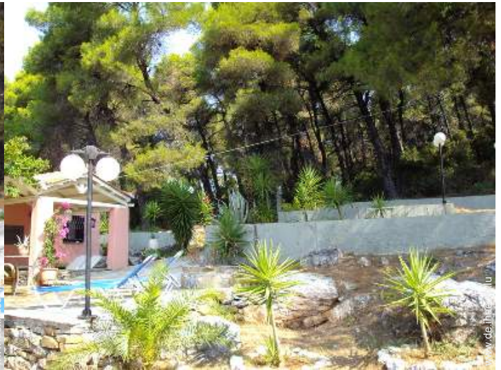
Blick auf Wald