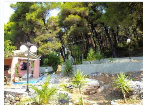
Blick auf Wald