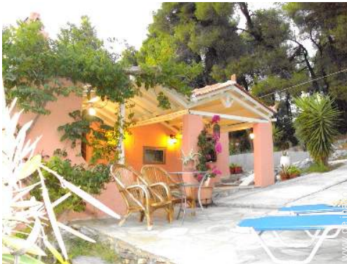
Blick auf Wald