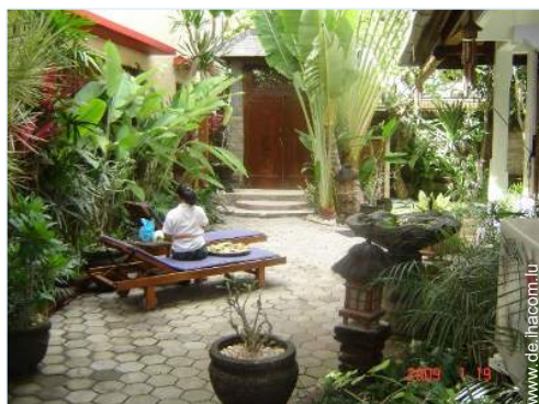
Blick auf Hof