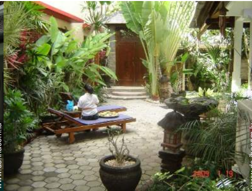
Blick auf Hof