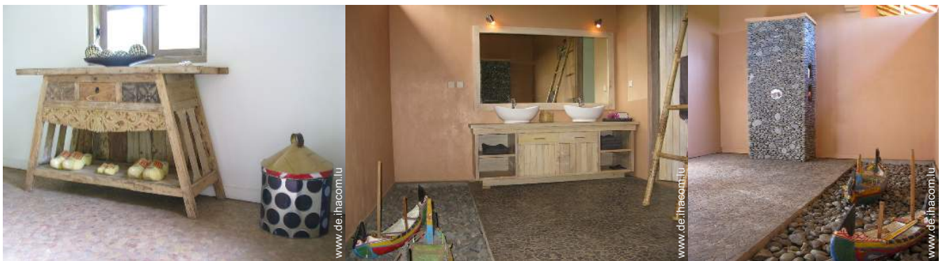
Raumaufteilung und Annehmlichkeiten