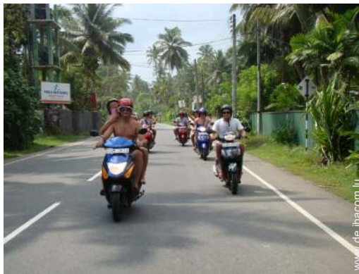
Motorsport in der Nähe