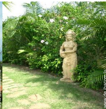
Blick auf Garten/Park