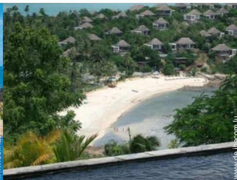
Blick auf Ozean