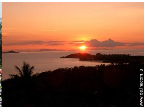
Blick auf Sonnenuntergang