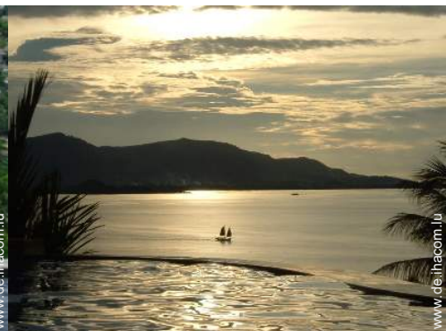
Blick auf Sonnenuntergang