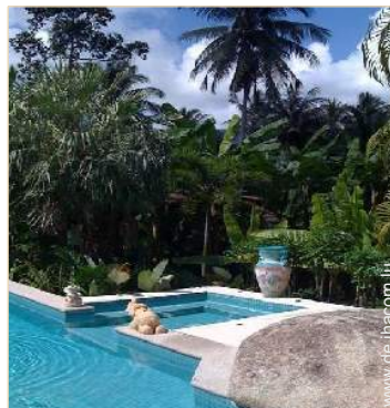
Blick auf Wald