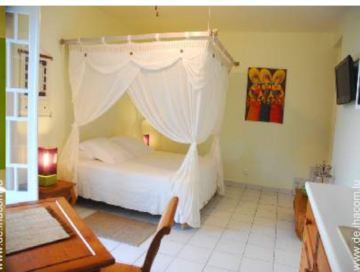
Studiowohnung mit Charme