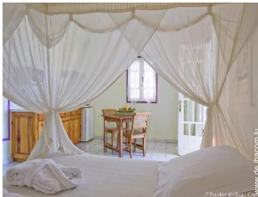
Studiowohnung mit Charme