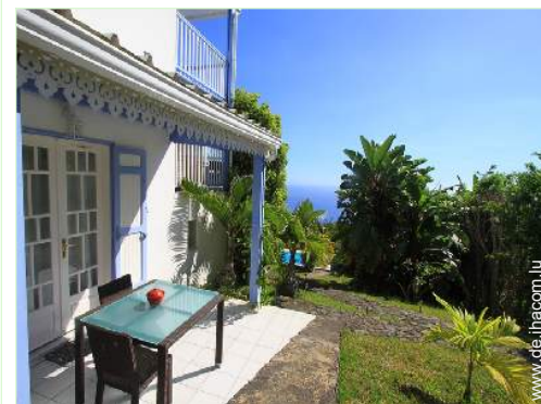
Studiowohnung mit Charme