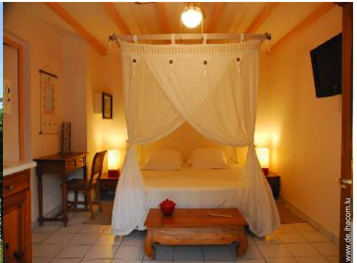
Studiowohnung mit Charme