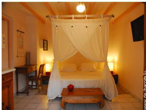
Studiowohnung mit Charme

Whirlpool, Klavier, Schnorchelausrüstung (en)