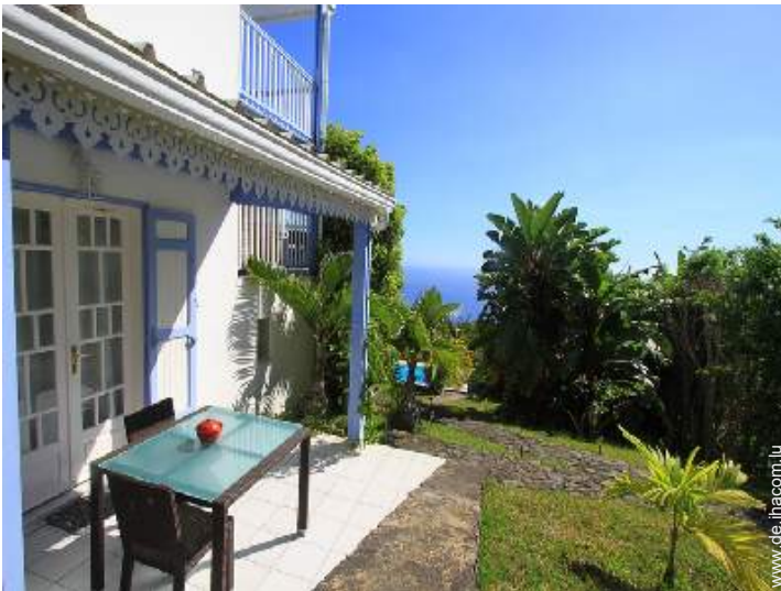
Studiowohnung mit Charme