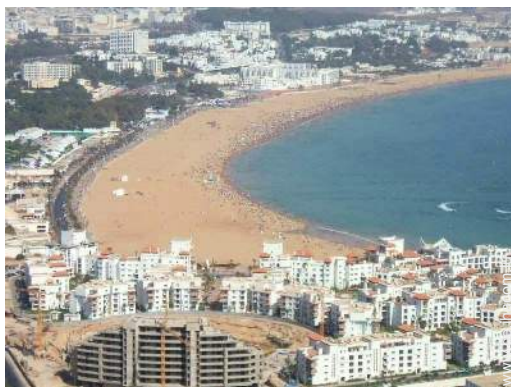
Blick auf Stadtzentrum