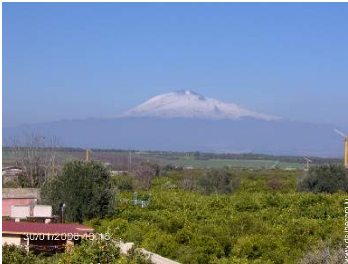
Blick aufs Land