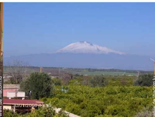
Blick aufs Land