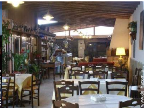
Raumaufteilung zur Verfügung der Gäste