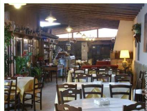
Raumaufteilung zur Verfügung der Gäste

- Stadtzentrum 3km - Bushaltestelle 3km - Straßenbahn 3km - Fahrrad-/Mountainbikeverleih <50m - Bäckerei 3km - Örtliche Geschäfte 3km - Supermarkt 3km - Internetcafé <50m - Post 3km - Bank 3km - Apotheke 3km - Arzt 3km - Krankenschwester 3km - Krankenhaus 3km - Ambulanz 3km