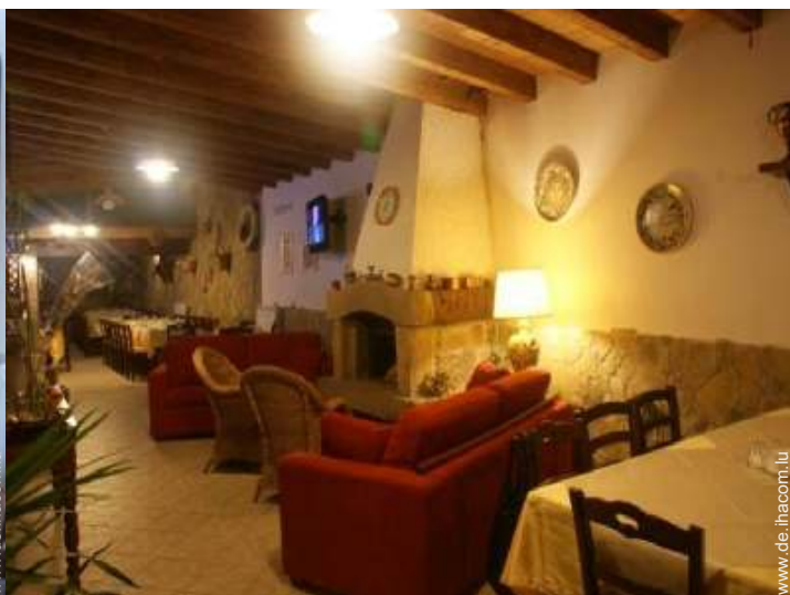
Innenkomfort zur Verfügung der Gäste