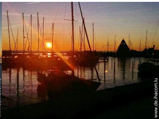
Blick auf Hafen