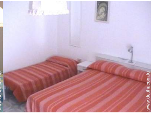
Klappbett(en) 1 Person