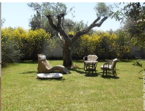
Blick auf Wiese