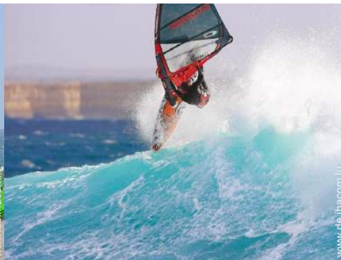
Wassersport in der Nähe