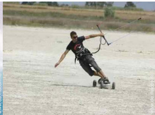
Flugsport in der Nähe