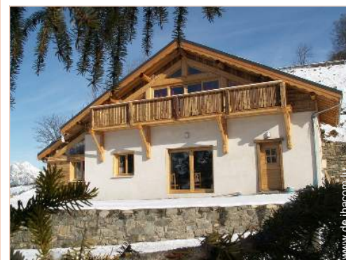
Bergchalet mit Charme