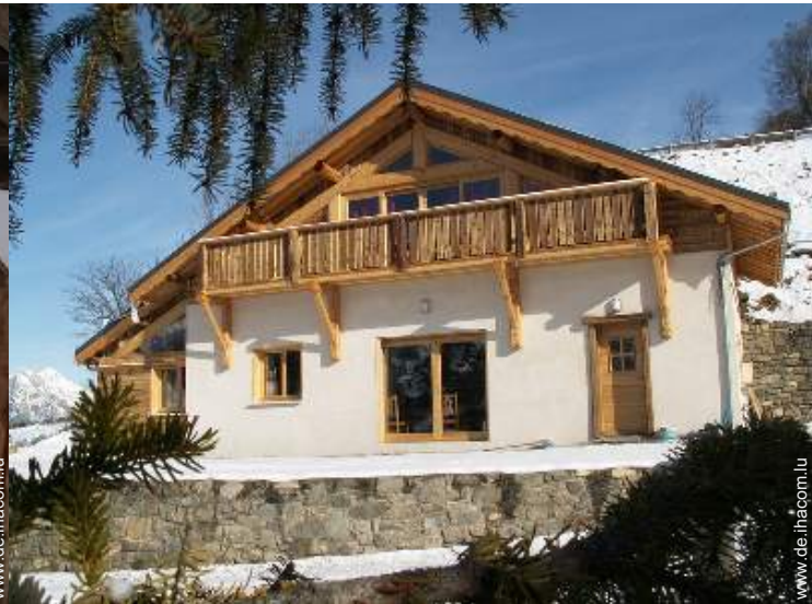
Bergchalet mit Charme