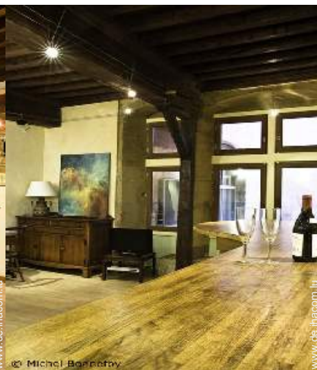
Raumaufteilung zur Verfügung der Gäste