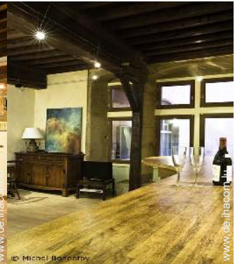
Raumaufteilung zur Verfügung der Gäste