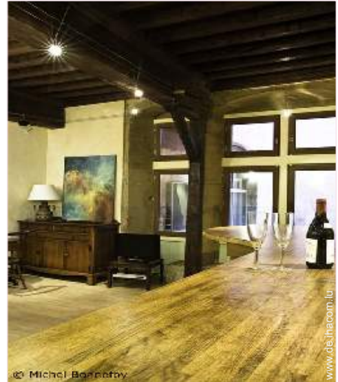
Raumaufteilung zur Verfügung der Gäste