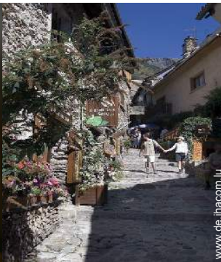
Blick auf Fußgängerzone