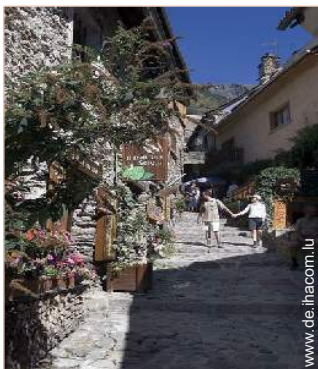
Blick auf Fußgängerzone