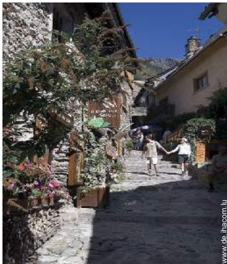
Blick auf Fußgängerzone