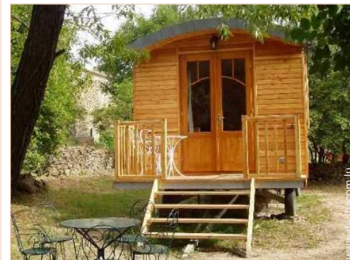
Wohnwagen mit Charme