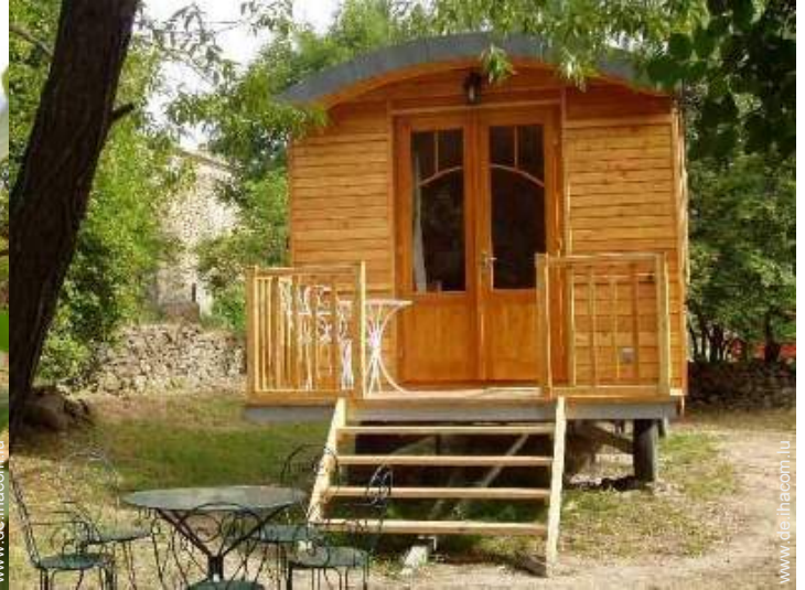
Wohnwagen mit Charme