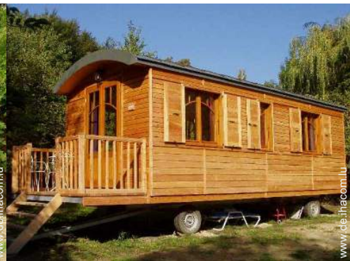
Wohnwagen mit Charme