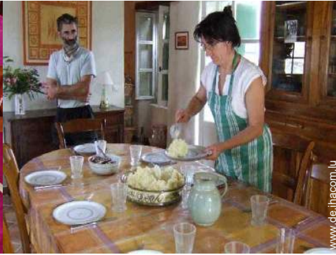
Table d'Hôte (Gemeinschaftstafel)