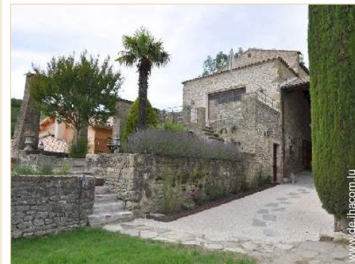
exklusives provenzalisches Haus