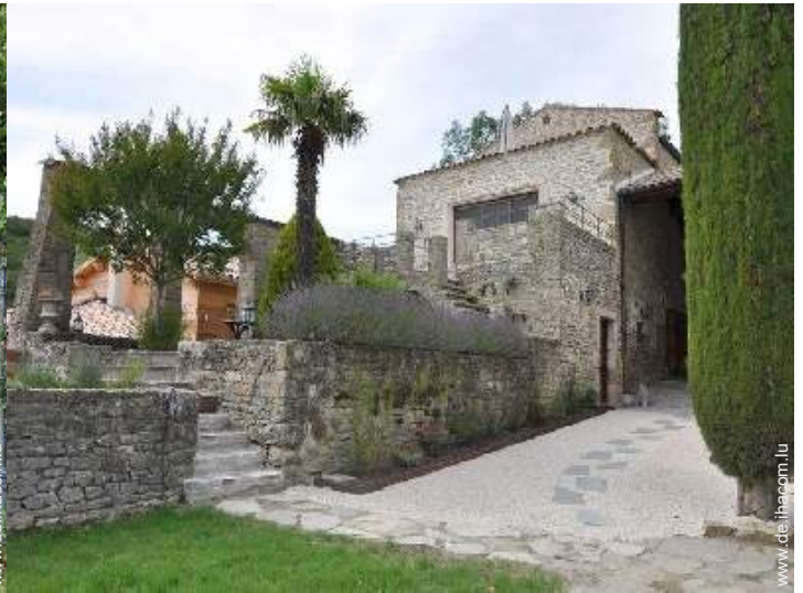
exklusives provenzalisches Haus