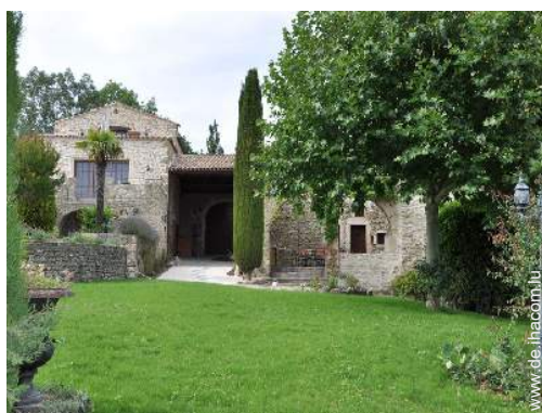
exklusives provenzalisches Haus