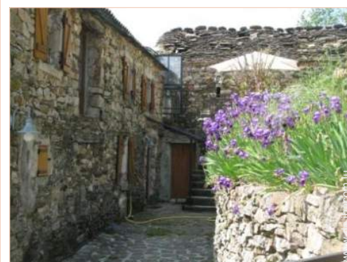
Steingebäude mit Charme