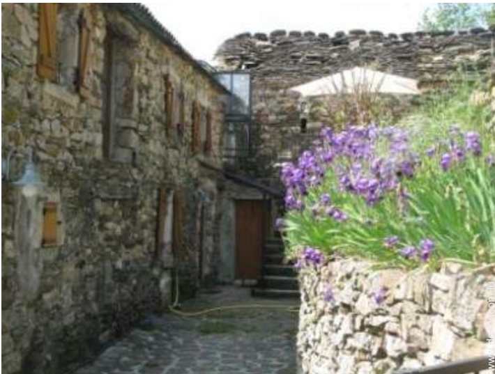
Steingebäude mit Charme