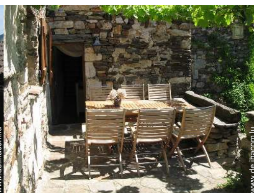
Steingebäude mit Charme