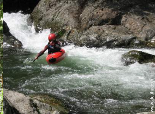
Blick auf Fluss