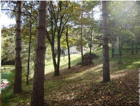
Blick aufs Land