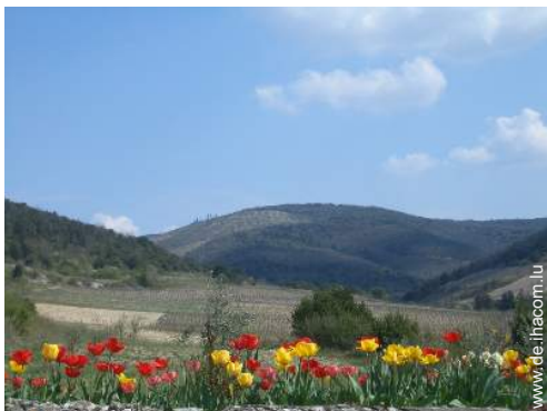
Blick auf Weinberge