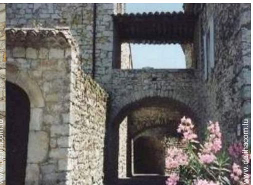
Blick auf Dorf