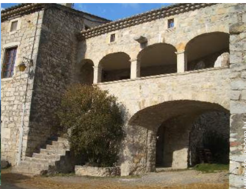
Blick auf Dorf