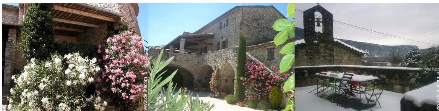
Blick auf Dorf