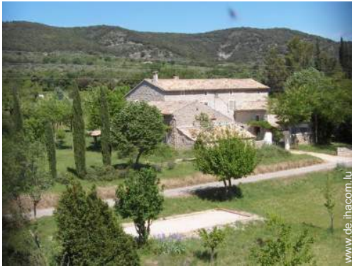
Bauernhaus mit Charme (Mas)