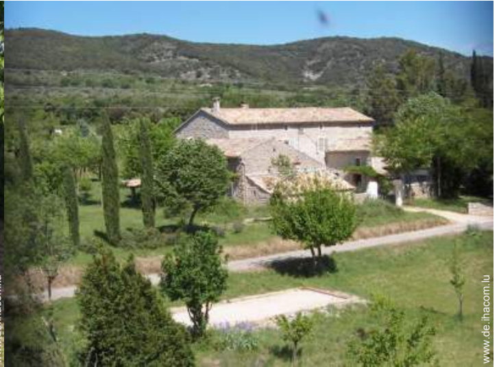
Bauernhaus mit Charme (Mas)