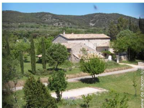
Bauernhaus mit Charme (Mas)