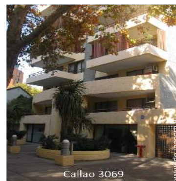
Callao 3069 Wohngebäude