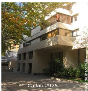
Callao 2975 Wohngebäude