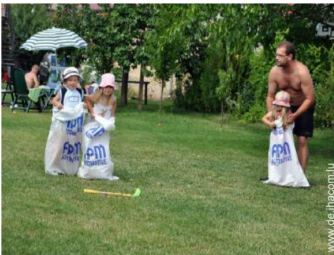
Blick auf Wiese