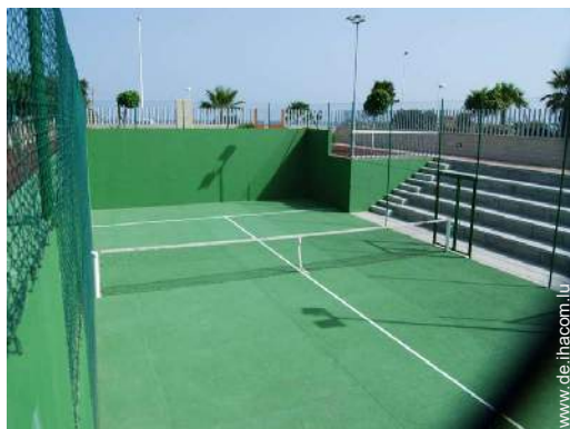
Tennisplatz - harter Belag