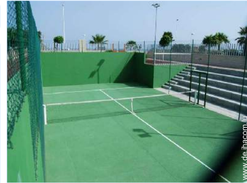
Tennisplatz - harter Belag