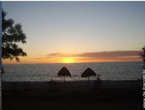
Blick auf Sonnenuntergang