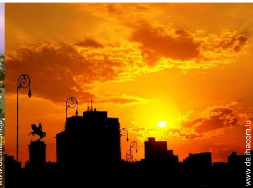
Blick auf Denkmal