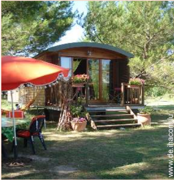
Wohnwagen mit Charme