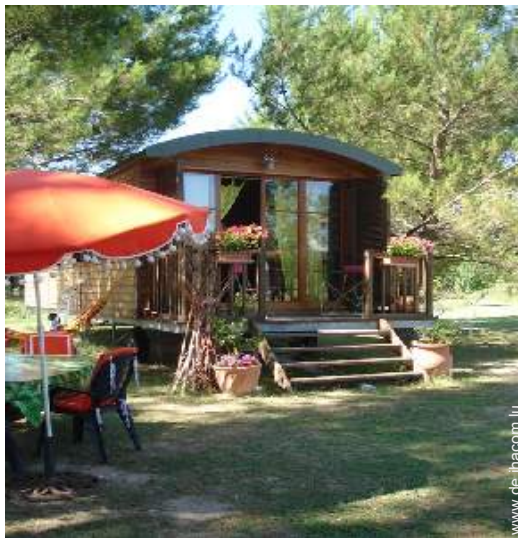
Wohnwagen mit Charme