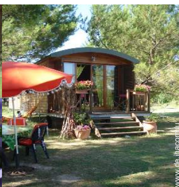
Wohnwagen mit Charme