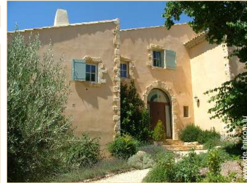
exklusives provenzalisches Haus