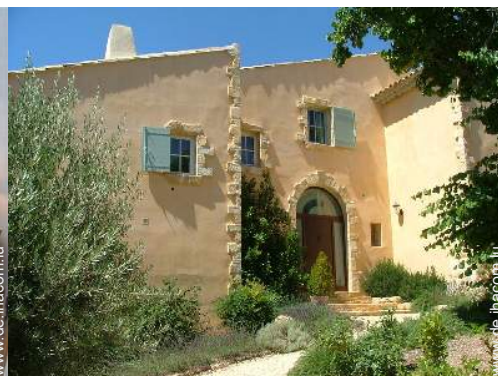
exklusives provenzalisches Haus