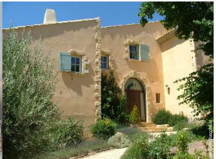
exklusives provenzalisches Haus