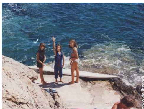
direkter Zugang zum Strand