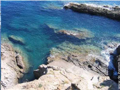
direkter Zugang zum Strand