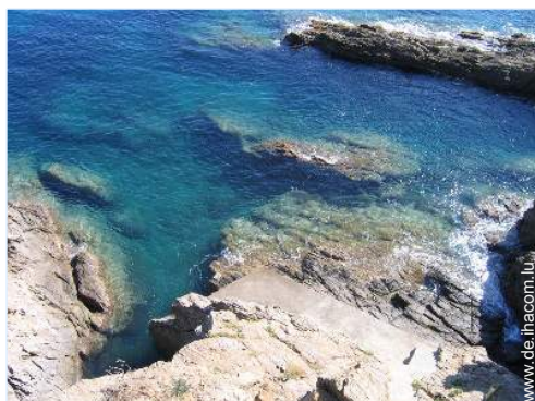
direkter Zugang zum Strand