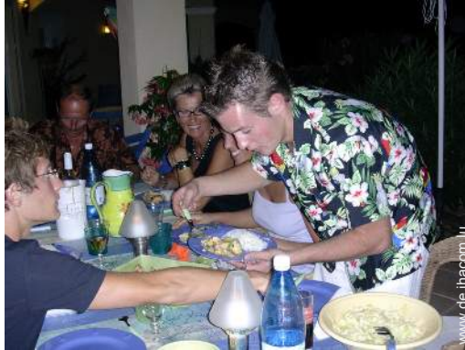
Table d'Hôte (Gemeinschaftstafel)