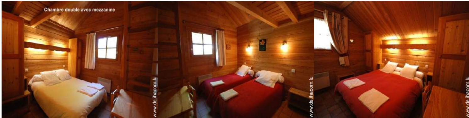
Chambre double avec mezzanine