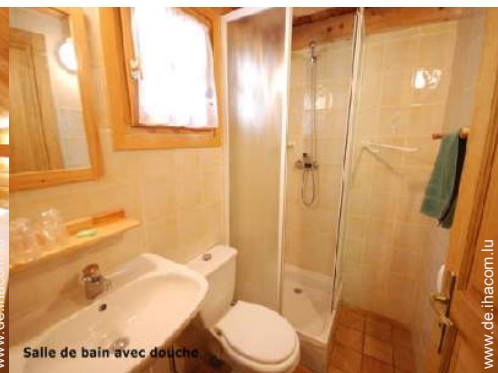
Salle de bain avec douche