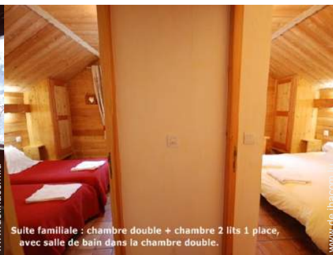
Suite familiale : chambre double + chambre 2 lits 1 place, avec salle de bain dans la chambre double.