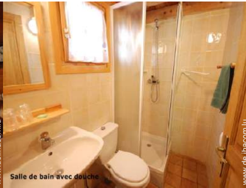
Salle de bain avec douche