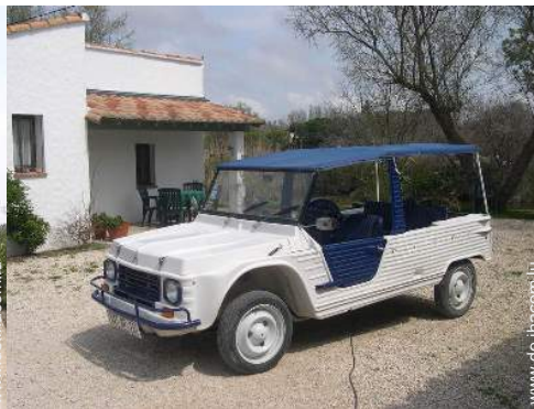
Vor Ort anwesend